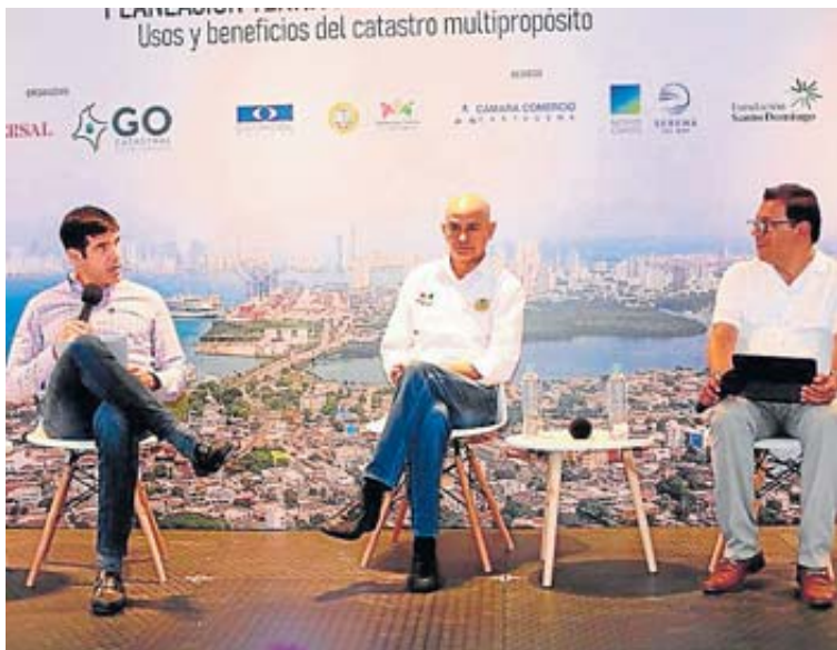
Segundo panel del foro.